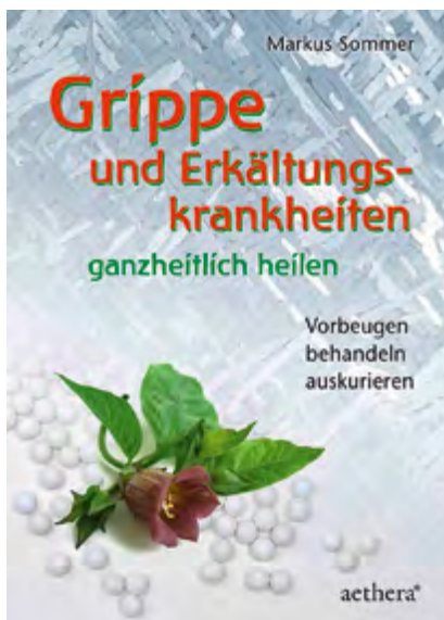
Markus Sommer, Grippe- und Erkältungskrankheiten ganzheitlich heilen , Vorbeugen - behandeln - auskurieren, 208 Seiten, Broschur zahlreiche farbige Abbildungen € 24,00 Art.Nr. 5403

Markus Sommer gibt eine Fülle von Hinweisen, was jeder Mensch bei Grippe und Erkältungskrankheiten zur Vorbeugung und Heilung beitragen kann.