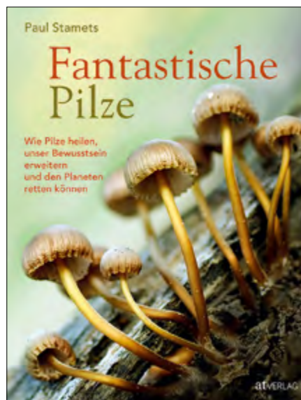
Paul Stamets, Fantastische Pilze , Wie Pilze heilen, unser Bewusstsein erweitern und den Planeten retten, 184 Seiten, gebunden, mit Fadenheftung, viele farbige Fotos, Format: 20 cm x 26 cm € 29,00 Art.Nr. 5408

Ein visionäres Lesebuch über das fantastische Phänomen Pilze mit atemberaubenden Nahaufnahmen und vielfältigen Beiträgen renommierter Expert:innen.