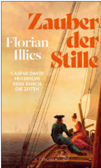
Florian Illies, Der Zauber der Stille Caspar David Friedrichs Reise durch die Zeiten, 256 Seiten, gebunden mit Schutzumschlag € 25,00 Art.Nr. 5373

Kein deutscher Maler löst solche Emotionen aus wie Caspar David Friedrich. In seiner groß angelegten Reise durch die Zeiten erzählt Florian Illies erstmals die Geschichte der Bilder Friedrichs.