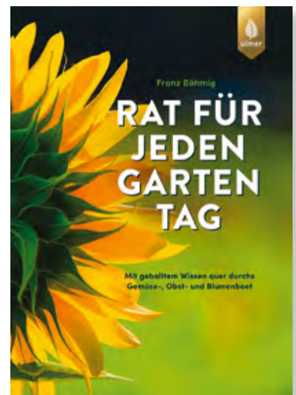
Franz Böhmg, Rat für jeden Gartentag , Mit geballtem Wissen quer durchs Gemüse-, Obst- und Blumenbeet, 448 Seiten, gebunden, Fadenheftung; mit vielen farbigen Zeichnungen, Fotos und Tabellen, Format 27 x 20,5 cm € 28,00 Art.Nr. 5404

1700 Ratschläge, mehr als 500 erläuternde Zeichnungen sowie 55 Tabellen: Geballtes Gartenwissen für Ihren Gemüse-, Obst- und Ziergarten!