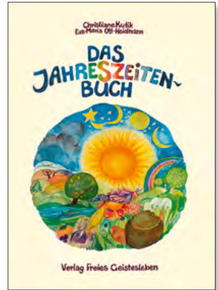
Christiane Kutik, Das Jahreszeitenbuch 320 Seiten, gebunden, Fadenheftung; mit Lesebändchen; illustriert von Eva-Maria Ott-Heidmann, Format 28 x 22 cm € 28,00 Art.Nr. 5405

Das Jahreszeitenbuch ist wie ein Freund, der durch den ganzen Jahreskreis hindurch Ideen parat hat, wie man Kinder zu phantasievollen Beschäftigungen anregt.